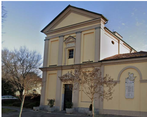
Chiesa di Santa Maria Assunta (Frazione Triulza)