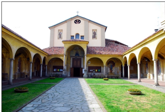
Chiesa di Santa Maria delle Grazie (dei Frati)