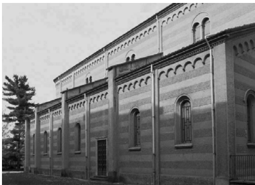
Chiesa Monte Tabor

Il complesso monastico è situato in via S. F. Cabrini. Al suo interno si trovano la Chiesa ed il convento che venne fondato da Madre Cabrini dopo aver acquistato l'esistente convento costruito dai Francescani Riformati (1623) e soppresso nel 1780. La Chiesa del Monte Tabor, in puro stile romanico lombardo, è stata costruita nel 1925. Nel 1953 in onore di Santa Cabrini venne eretta all'interno della Chiesa una Cappella votiva. Sull'altare troneggia una marmorea statua bianca, su modello di quella che si trova a San Pietro, e nella base è collocato un prezioso reliquiario che racchiude il cuore della Santa. Il Convento è stato oggetto di importanti lavori di riqualificazione con parziale trasformazione di un'ala, precedentemente adibita a edificio scolastico, in casa di riposo privata. All'interno del convento è allocato il Museo Cabriniano che conserva diverse reliquie della Santa. Occupa un'area di mq. 16.139.