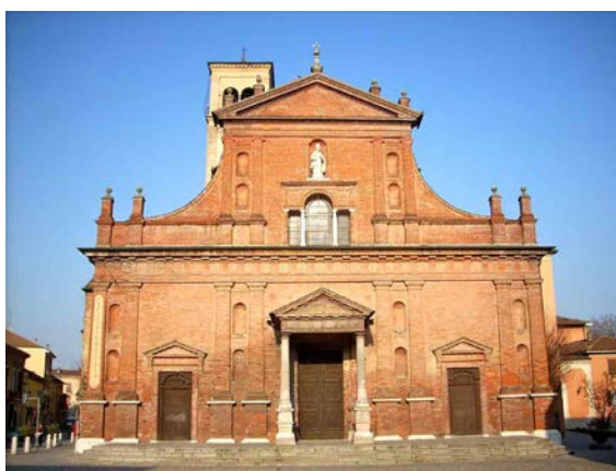
La Collegiata di San Biagio e Beata Vergine Immacolata