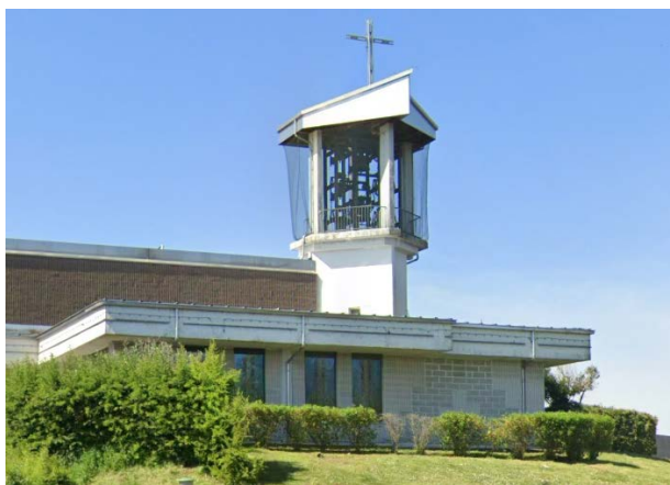
Chiesa di Santa Francesca Cabrini