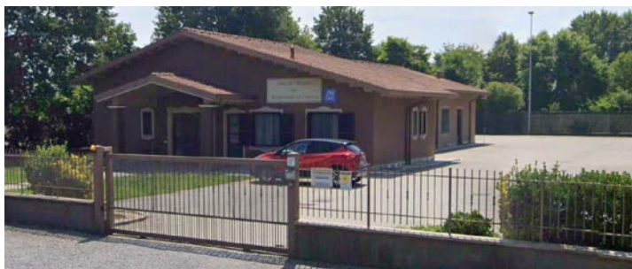
Sala del Regno dei Testimoni di Geova