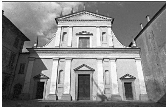
Chiesa della Trinità in Codogno