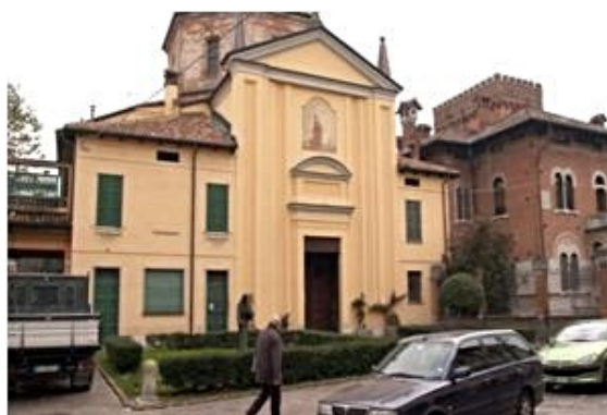
Chiesa di San Teodoro (del Cristo)