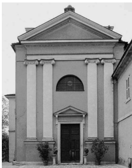
Chiesa di San Giorgio

Occupava un'area di mq 160, la Chiesa è parte integrante della RSA.