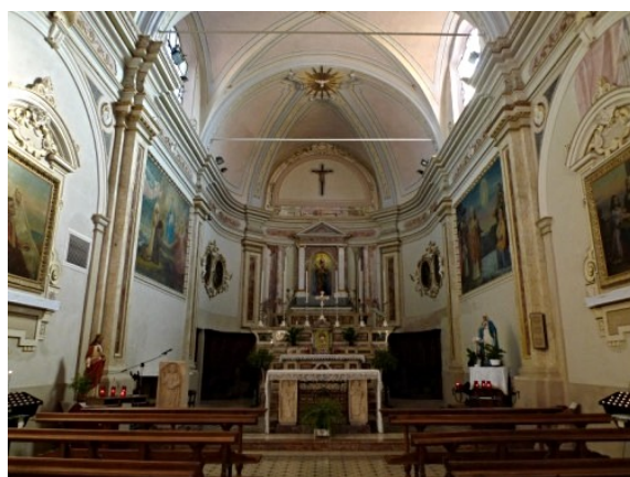
Chiesa della Madonna della Neve (Santa Maria)