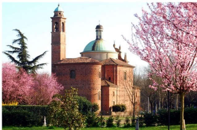
Santuario della Madonna di Caravaggio in Codogno