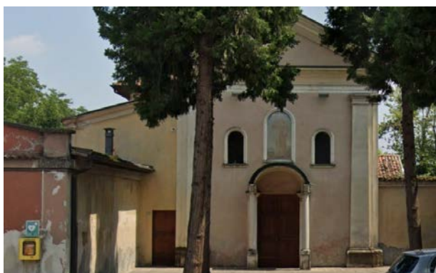
Chiesa di San Bernardino (Frazione Maiocca)